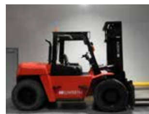
OCCASION HC CPCD80-RW28 (7985)