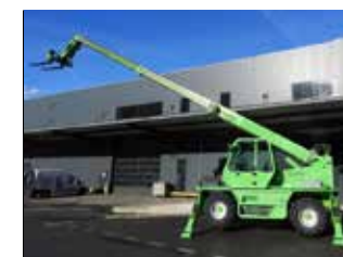
OCCASION ROTO 30.13 EV (8473)