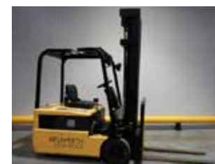
OCCASION B18T-2 (2695)