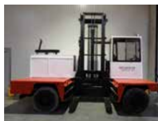
OCCASION FANTUZZI SF 50 (5321)