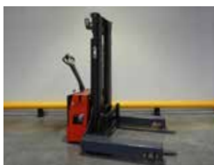
OCCASION NESLIFT SR 1600 4-WAY (8370)

Gerbeur multidirectionnel Capacité 1'600 kg Hauteur de levée 5'000 mm Levée libre 150 mm Mât fermé 2'350 mm