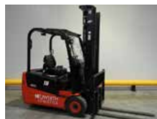
OCCASION HANGCHA CPDS18J-C1 (4812)