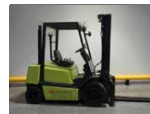
OCCASION GDP 20TF V3020 (2312)