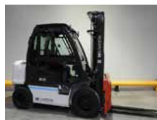
DÉMONSTRATION UNICARRIERS DL 32 (3568)