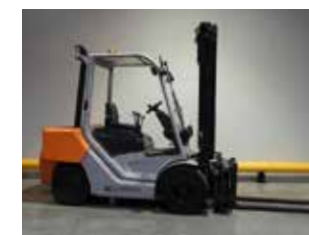
OCCASION RC 40 - 35 (3281)