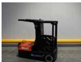
MACHINE D'EXPO NESLIFT JX0 (1593)

Préparateur de commande Capacité 300 kg Hauteur de levée 3'000 mm Hauteur de travail 5'000 mm