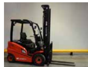
OCCASION HC CPD20-AC4 (2922)