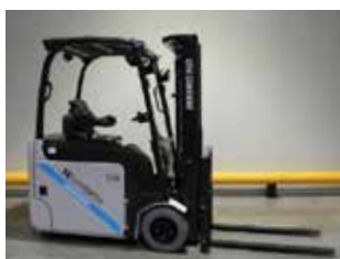
MACHINE DE DÉMO UNICARRIERS TX3-16 (3570)