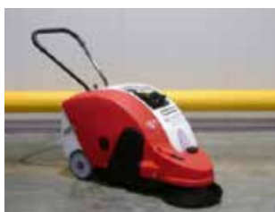
LIQUIDATION (NEUVE) RCM ALFA H (1977)