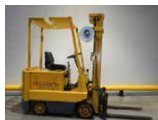
OCCASION LBX20 (9930)