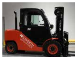
EXPOSITION HC CPCD50-XXW58B (3184)