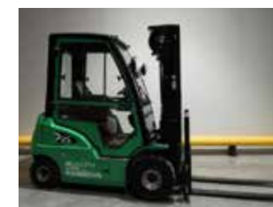
EXPOSITION HC CPD25-XD4-SI26 (3277)