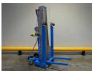
LIQUIDATION (NEUF) NESLIFT MAWP20 (2343)