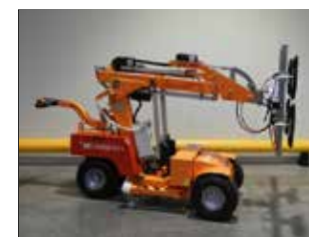
DÉMO SMARTLIFT SL 608 HL (2668)

Robot à ventouses Capacité 608 kg Hauteur de levée 4'200 mm