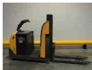
MACHINE DE DÉMO ATLET PPC (6503)

Préparateur de commande Capacité 1'200 kg Hauteur de levée 950 mm avec plateforme élevable, direction assistée, BFS.