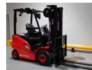
OCCASION HC CPD20-AC4-E/I (3040)