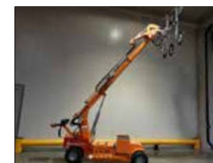
DÉMO SMARTLIFT SL 1008 (2667)

Robot à ventouses Capacité 1'000 kg Hauteur de levée 4'400 mm