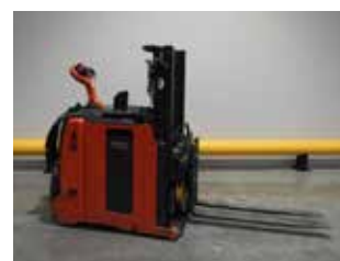
OCCASION L06 ACAP (1313)