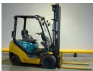
OCCASION KOMATSU FG15HT-20R (9459)