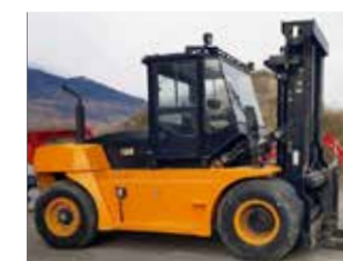
MACHINE DE DÉMO HC CPCD160-XW25 (8824)