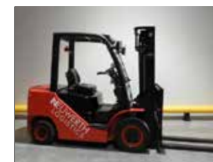
OCCASION HC CPCD25-XW27F (1150)