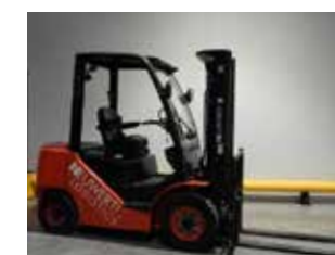
DÉMONSTRATION HC CPCD25-XW55F (3166)