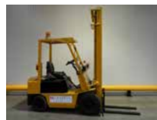
OCCASION KOMATSU FG18I-14 (8871)