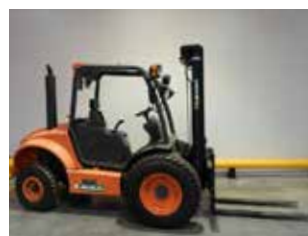
OCCASION AUSA C250H 2WD (9845)