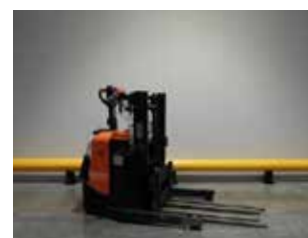
OCCASION SPE 125 (5799)