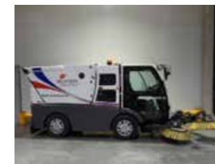
OCCASION DULEVO Sky 2000 (9723)