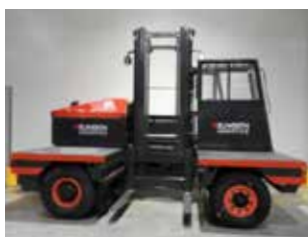
OCCASION S50 (3946)