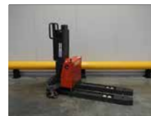
LIQUIDATION (NEUF) NESLIFT SL 500 NL (4128)