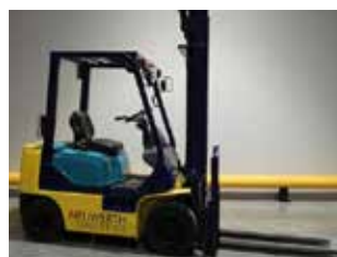
OCCASION KOMATSU FG15HT-17 (7491)