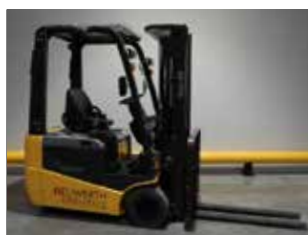
OCCASION ATLET ET 18 (2934)