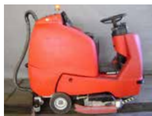
OCCASION RCM JUMBO 962 (6665)