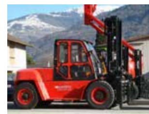
MACHINE DE DÉMO HC CPCD100-XW28 (6523)