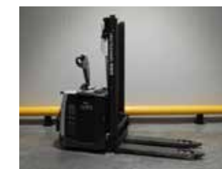
OCCASION UNICARRIERS PSP 125 (1213)