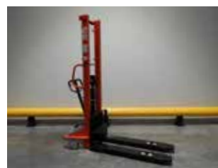
LIQUIDATION (NEUF) NESLIFT SM 1000 X (2508)