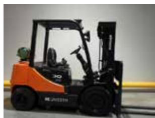
OCCASION G30P-5 (6312)