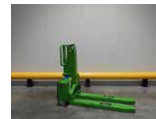
OCCASION NESLIFT SELFLOADER (8733)