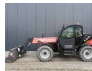
OCCASION FARESIN FH 9.30 FHTR (8802)