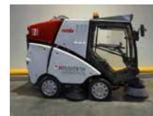
OCCASION RCM RONDA (5486)