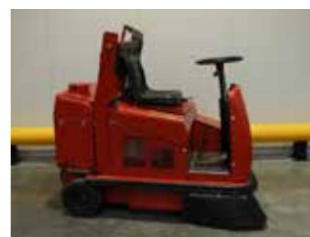
OCCASION RCM R703 SACK (1586)