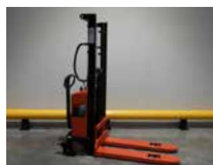
OCCASION NESLIFT SB 1000 (4611)