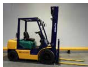
OCCASION KOMATSU FD25T-12 (1276)