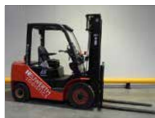
OCCASION HC CPCD25-XW27F (1141)