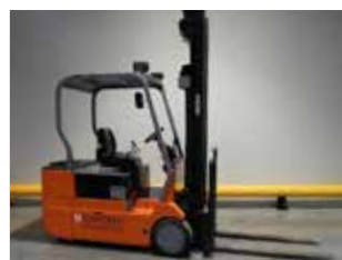
OCCASION N20.3 (9875)