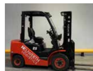
OCCASION HC CPQD25-XW22F (3038)