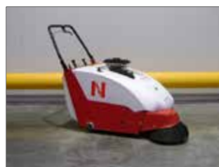
OCCASION RCM BRAVA 800 (5462)