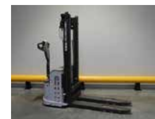
MACHINE D'EXPO (NEUF) UNICARRIERS PS 125 (9060)