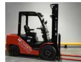
DÉMONSTRATION HC CPCD35-XW55F (3233)