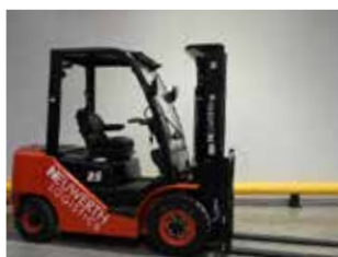
DÉMONSTRATION HC CPCD25-XW55F (3167)