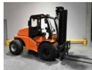
OCCASION MAST H35DA-4WD (1803)