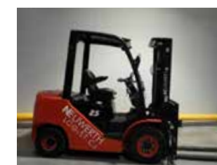
DÉMONSTRATION HC CPCD25-XW55F (3159)