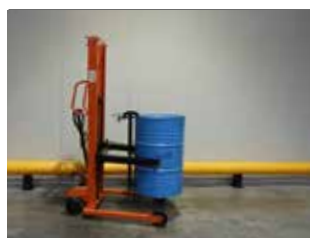
LIQUIDATION (NEUF) NESLIFT SM 350 F (6767)