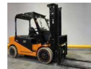
OCCASION HANGCHA CPD50J-C2 (1161)